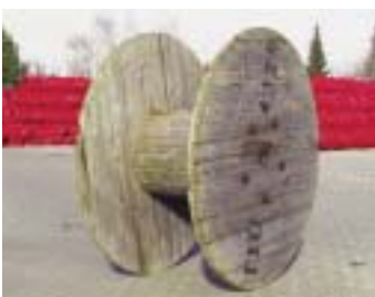
M6500 - барабан M220

размер: 200 x 65 x 2,6 см EAN: 8595057687738